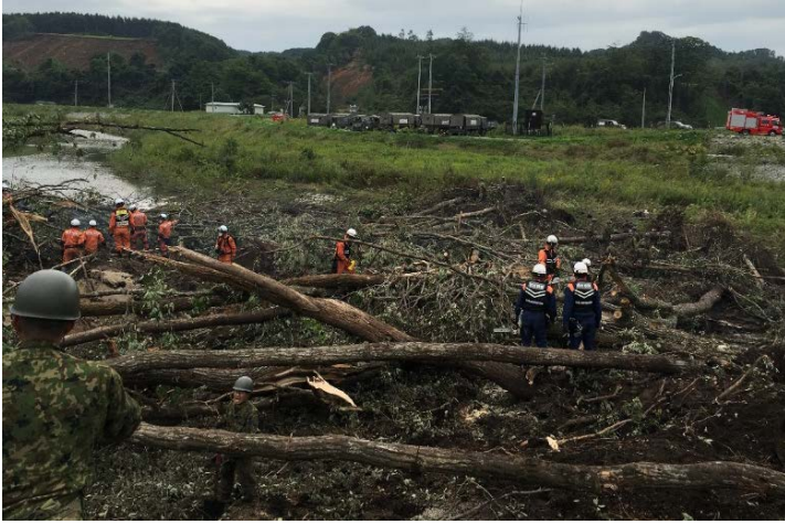
救助活動の様子 【厚真町】