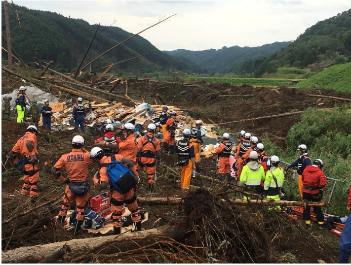
救助活動の様子 【厚真町】