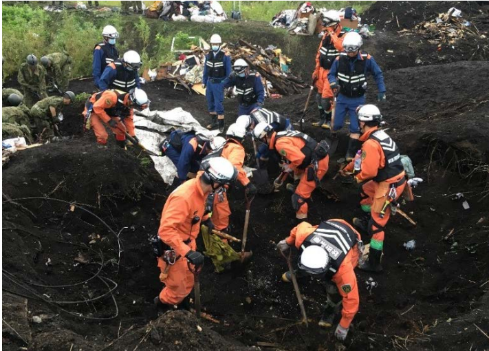
救助活動の様子 【厚真町】