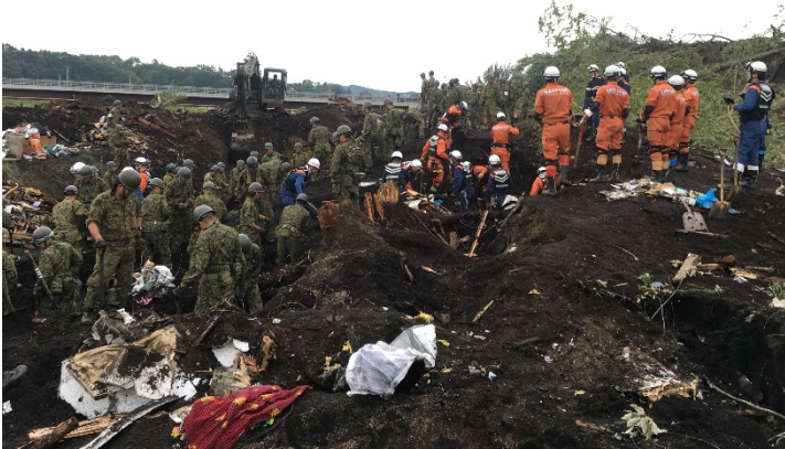
救助活動の様子 【厚真町】