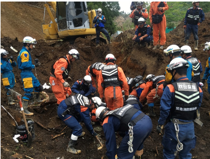
救助活動の様子 【厚真町】