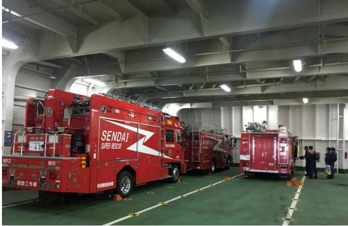
フェリーでの進出 【青森港】