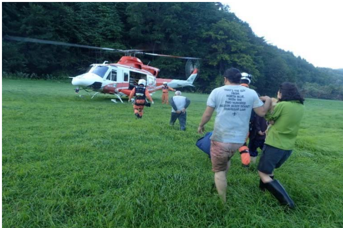
救助活動の様子 【厚真町】