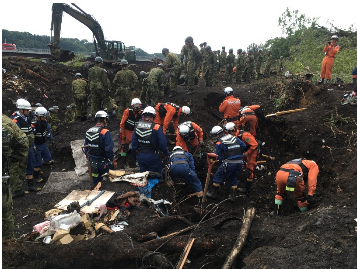
救助活動の様子 【厚真町】