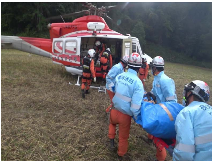
救助活動の様子 【厚真町】