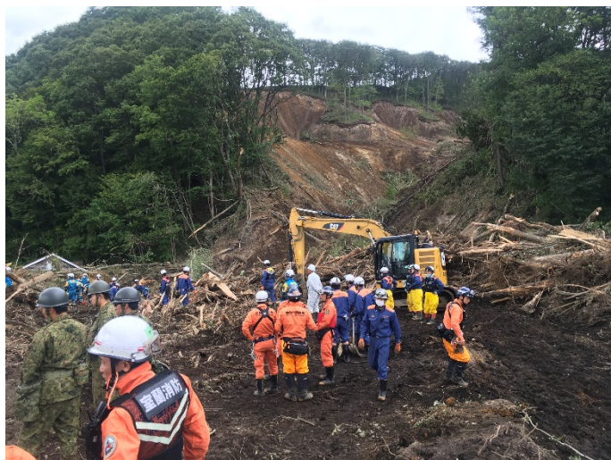
救助活動の様子 【厚真町】