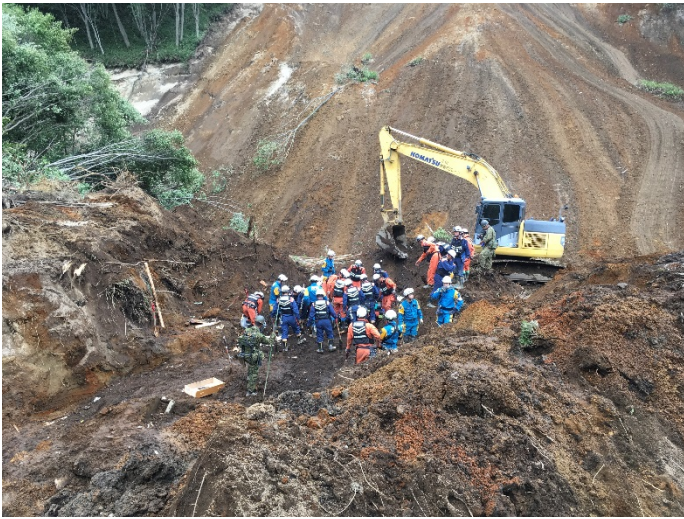
救助活動の様子 【厚真町】