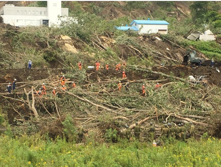
救助活動の様子 【厚真町】