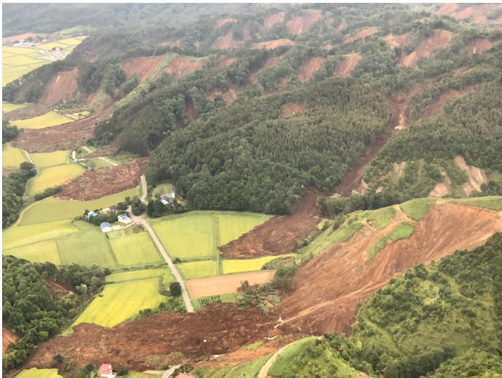
情報収集の様子 【厚真町】