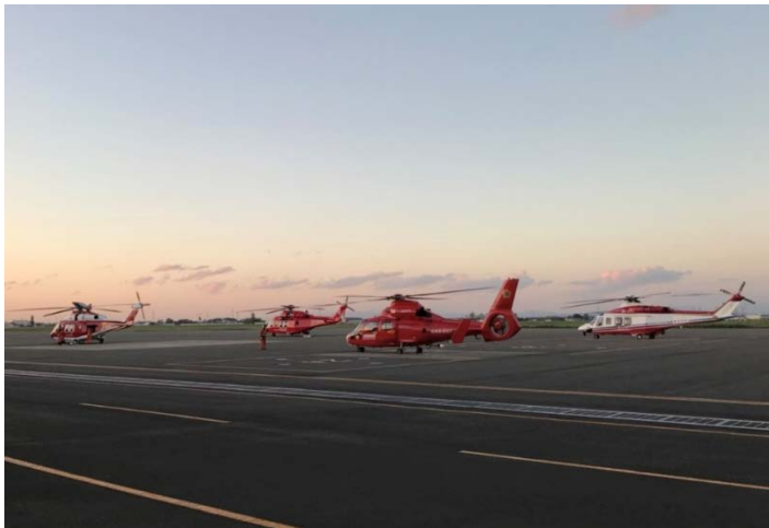
ヘリベース 【丘珠空港】