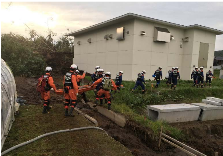
救助活動の様子 【厚真町】