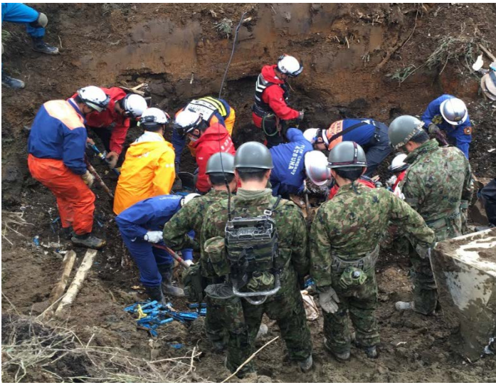
救助活動の様子 【厚真町】